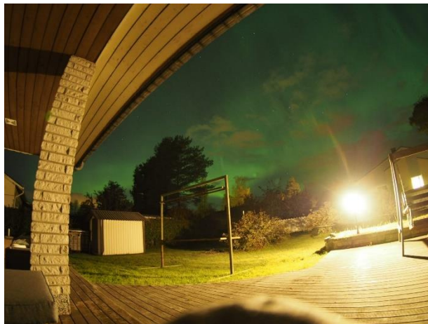
↑ Joensuu で見れたオーロラ

↓BBQ のとき。北欧独特の地層がよく観察できて感動しました。（立っている下の岩）