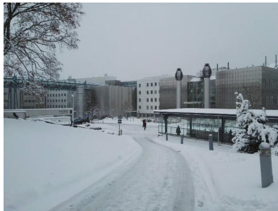
雪が降った日の大学の様子