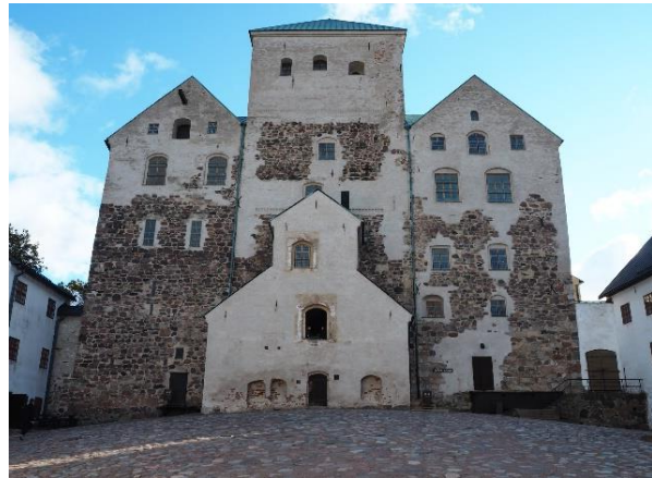
トゥルクに出かけた時の写真（トゥルク城）