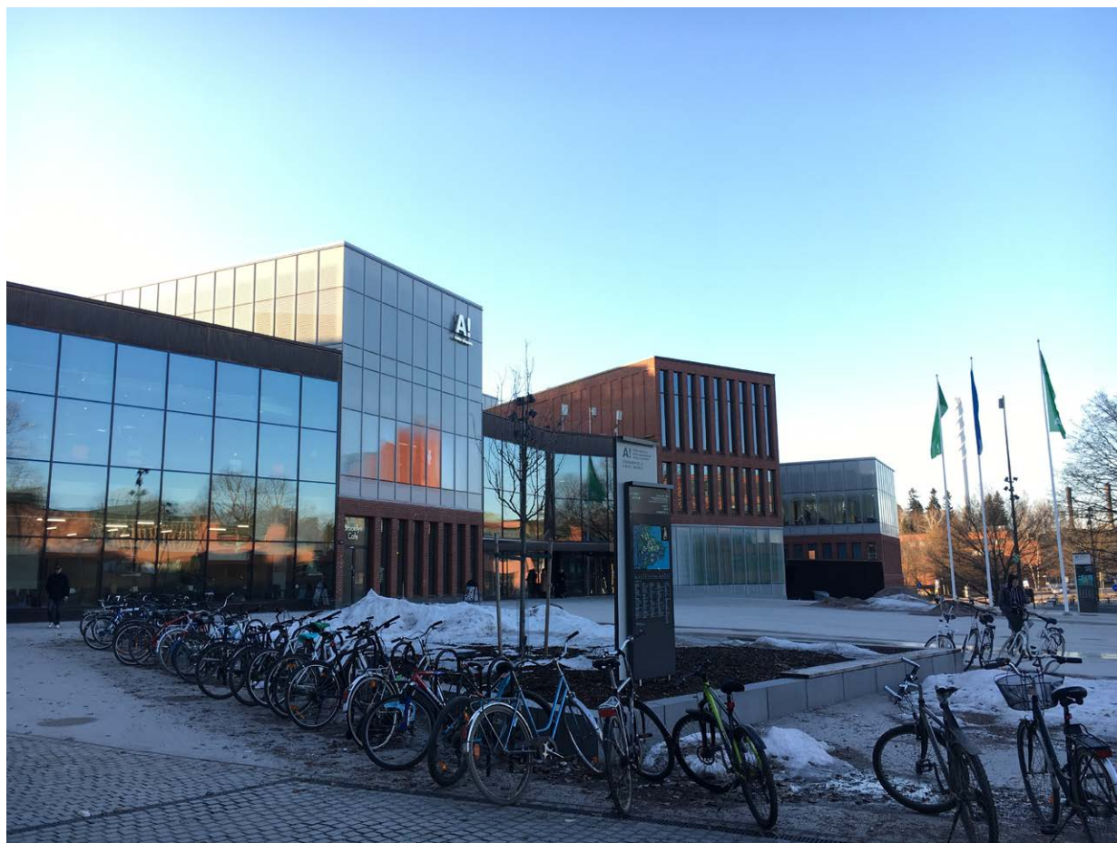
現在夜8時のアアルト大学